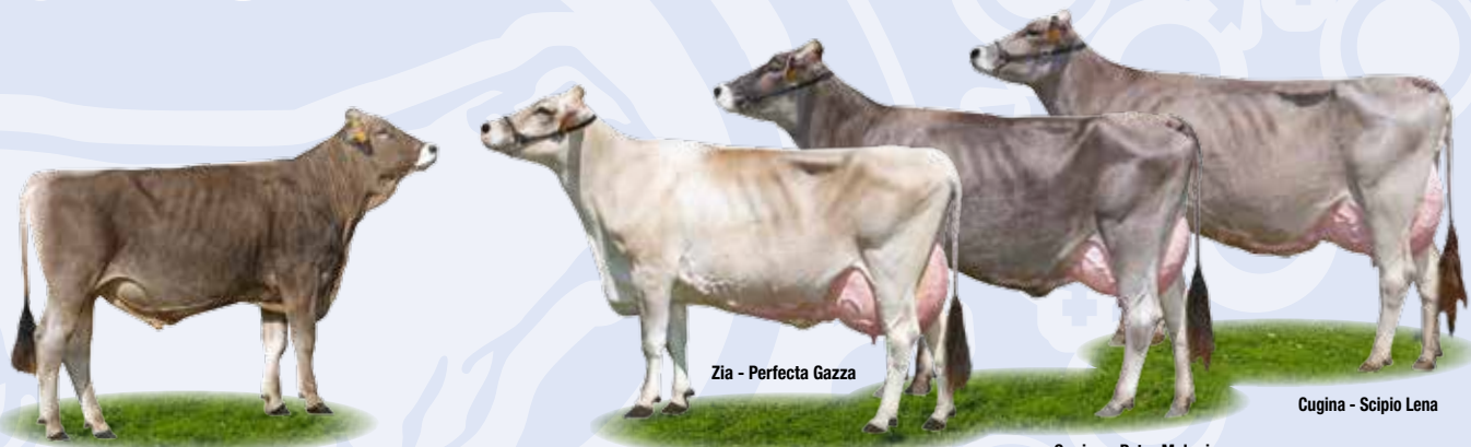
Zia - Perfecta Gazza

Superbrown Boray • IT026990445909 • K-BB • B-AzAz Boeing x Huray x Denmark