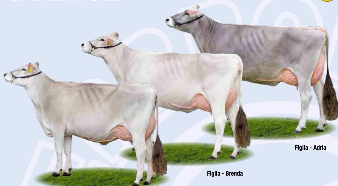
Figlia - Adria