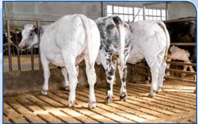
Kalbinnen aus der Kreuzung mit Superblu Bullen