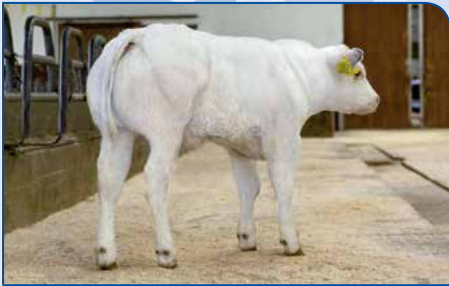
Kreuzungskalb mit einem Superblu Bulle