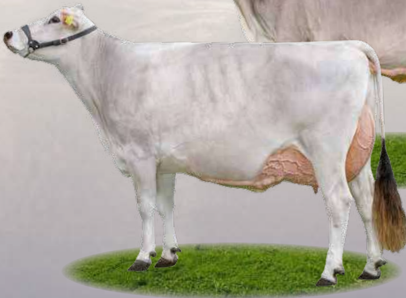
Arrow Nevada - Madre / Mutter