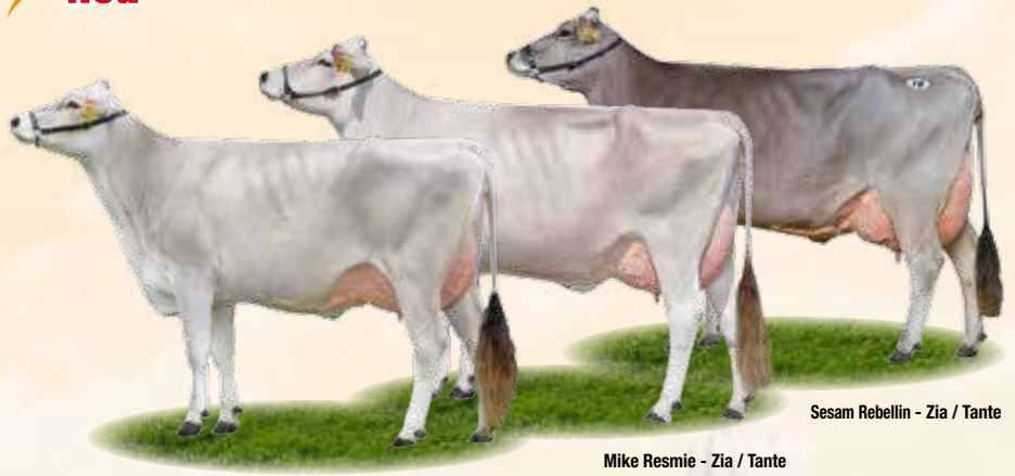
Sesam Rebellin - Zia / Tante