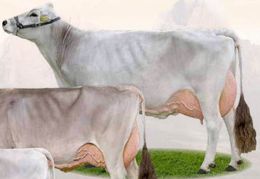
Payoff Naivi - Nonna / Großmutter