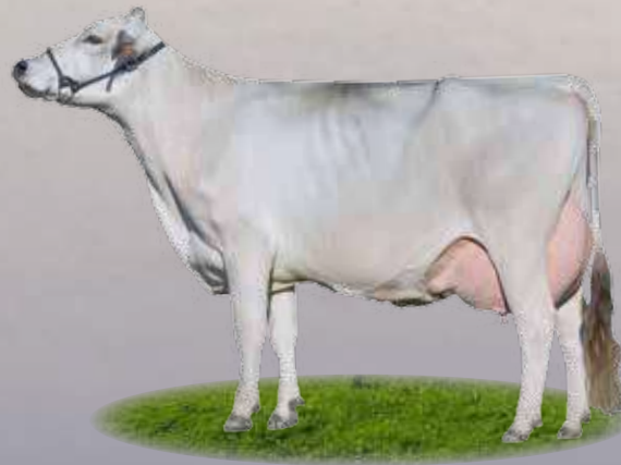
Potassio Nigeria - Madre / Mutter