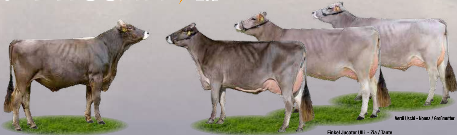
Verdi Uschi - Nonna / Großmutter