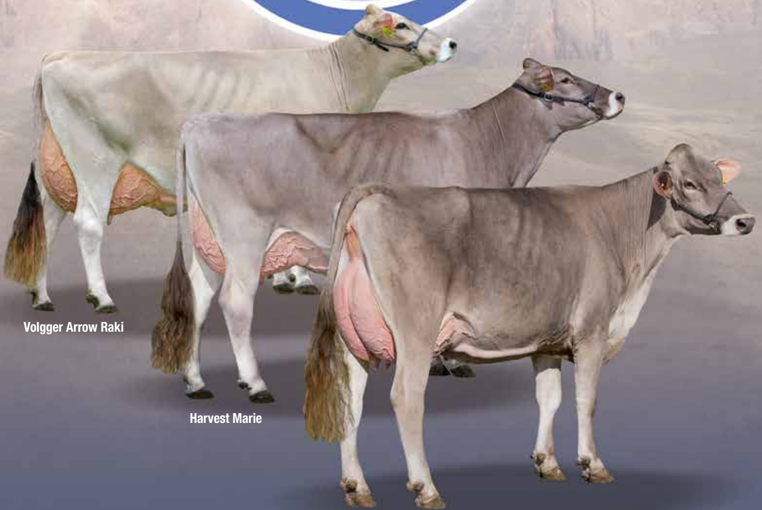
Volgger Arrow Raki