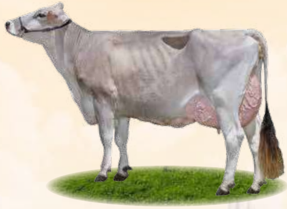
Noel Birba - Madre / Mutter