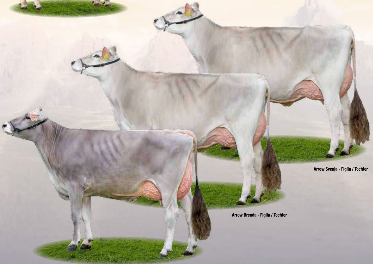
Arrow Svenja - Figlia / Tochter