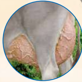
Mammella di Zelig Bella