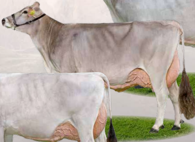
Payssli Nelli - Zia / Tante