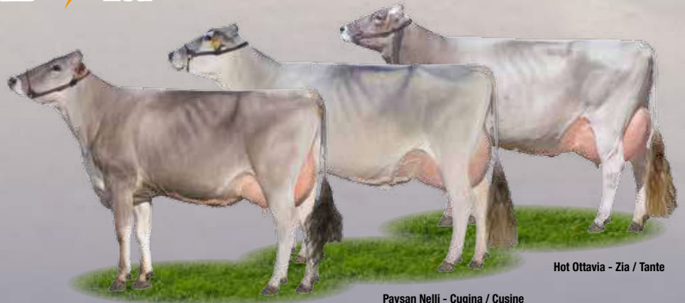
Jucator Germana - Madre / Mutter